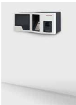
smart.BOOK® Wandmontage Abmaße (HxBxT): 368 x 813 x 335 mm

Individuell und kompatibel mit Ihrem bestehenden System