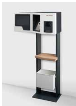
smart.BOOK® auf Stativ mit Papierkorb