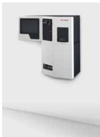
smart.BOOK® für Barzahlung Wandmontage Abmaße (HxBxT): 832 x 813 x 335 mm