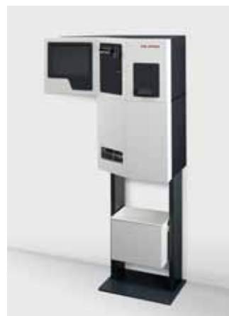
smart.BOOK® für Barzahlung auf Stativ mit Papierkorb