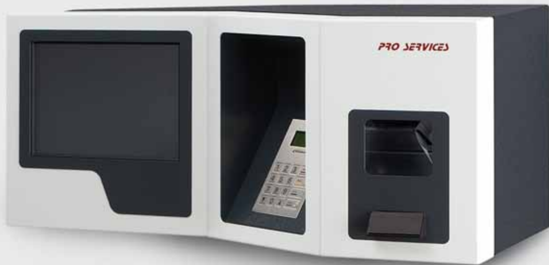
smart.BOOK® Automat für Karte mit Barcode zum Bezahlen mit girocard